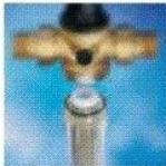
安全维修方便，可扩展功能